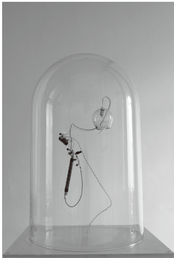
《 鈴 》2013

*Other events are held during the exhibition. More information will be available on the website.